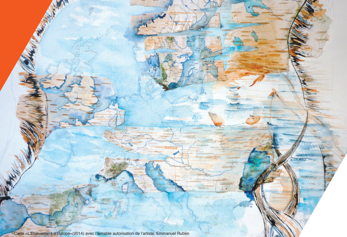
Carte «L'Enlèvement d'Europe»(2014) avec l'aimable autorisation de l'artiste, Emmanuel Ruben