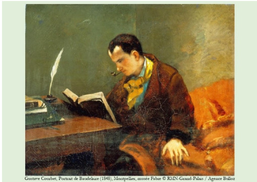
Gustave Courbet, Portrait de Baudelaire (1848), Montpellier, musée Fabre