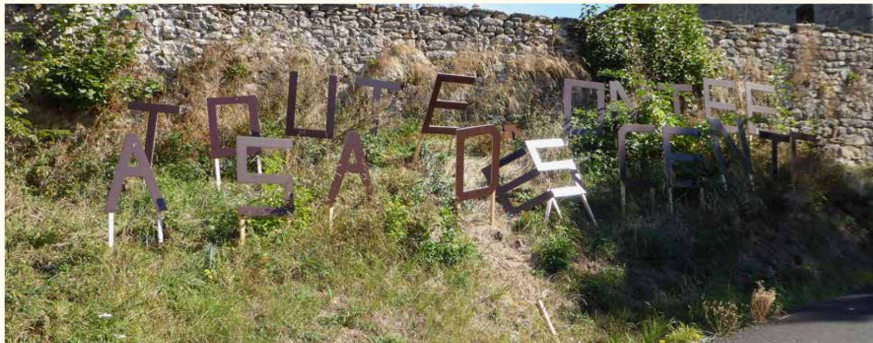
Chemin d'écriture « TOUTE MONTÉE A SA DESCENTE » / Lettres découpées en sapin sur sardines en bois

4 e de couverture « TRAVERSESES de l'étang des moines » / 14,00m x 0,60m, 2 x (8,00m x 0,60m) - Sapin et acier brut - Détail